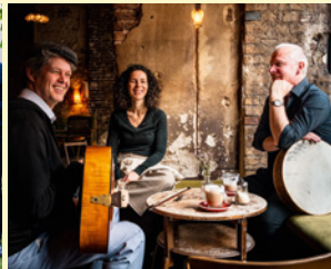
Peter-Pauls-Kantorei Sebnitz und Elbland Philharmonie Sachsen

Sonntag, 29. November 2026 · 16.00 Uhr George-Bähr-Kirche Hohnstein Musikalischer Gottesdienst am 1. Advent